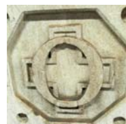
SBB «Kilometer 0»